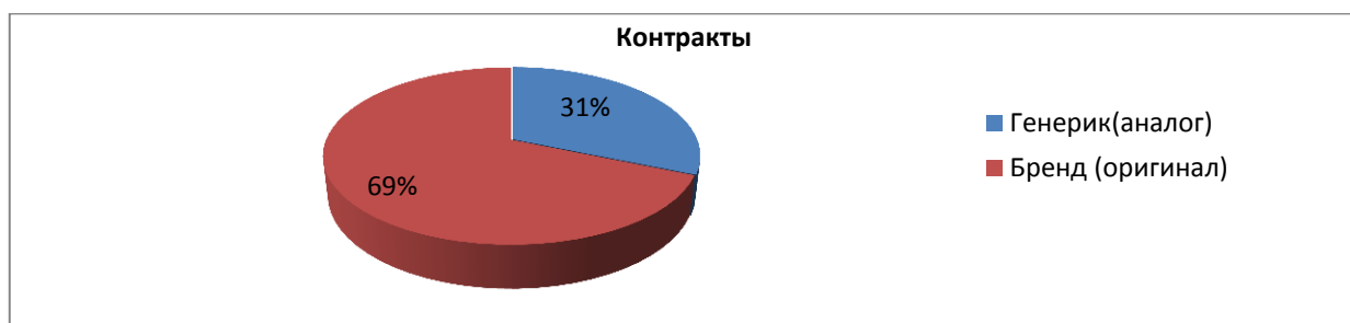
Рисунок 2. Бренд-генерик в процентном соотношении в заключенных контрактах